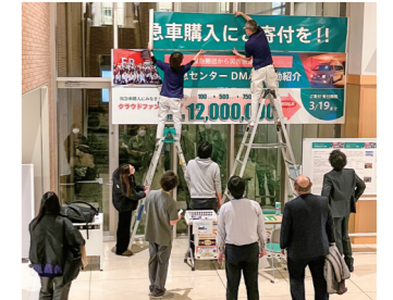
横断幕を貼り替え