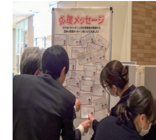
応援メッセージを貼り替え