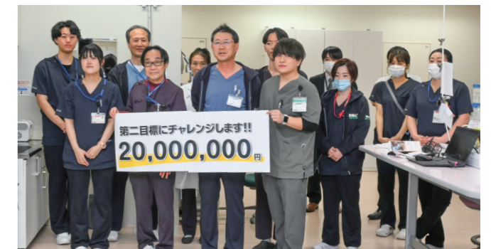
ネクストゴールに挑戦